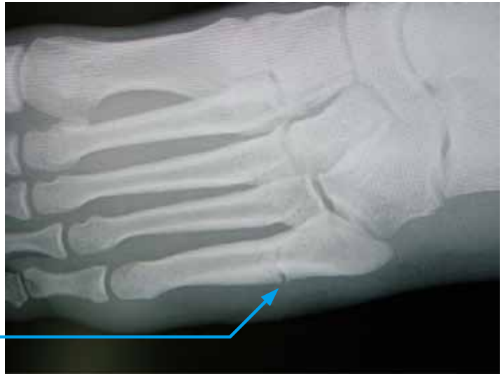
第5中足骨近位骨幹部疲労骨折例

X線撮影を行い骨折の部位や骨折の状態をみて診断します。MRI検査などを行う場合もあります。