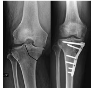
a. TCVO の計画 b. TCVO 術後

必要矯正角が大きい場合などで HTO 後に脛骨関節面が過度に外反となることがある。脛骨機能軸と脛骨関節面がなす内側の角を MPTA と表現する。HTO は MPTA を増大させる術式であるが、内反膝の原因が、脛骨近位の内反のみならず、関節面の内側閉鎖 (JLCA の増大) や大腿骨遠位の内反も関与している場合、その関与の程度によって、HTO のみで対処すると MPTA が過度に増大する可能性がある。その場合、地面