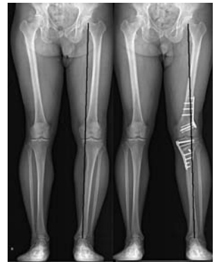
a. 術前全下肢正面 b. DLO 術後全下肢正面

に対して脛骨関節面が外方傾斜し、関節面に剪断力が働き、関節軟骨への悪影響が懸念される。生体力学的研究や臨床研究から、MPTA が 95 度を超えるとそのリスクが高いとされる。そのような場合、特に大腿骨遠位の内反が関与しているときには、大腿骨遠位外反骨切り術と HTO の併用を行う、Double level osteotomy (DLO) が検討される 4) 。DLO は術者にも患者にも負担が増加するが、術後の関節面は地面に対して水平に近くなり、生体力学的には利点が多いとされる。