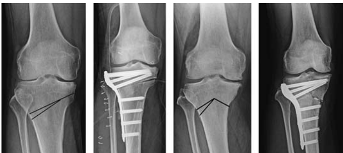
左から a. h-CWHTO 計画、b. h-CWHTO 術後、c. 逆 V 字 HTO 計画、d. 逆 V 字 HTO 術後

OWHTO で開大できる距離に限界があるため、大きな矯正には対応できない。開大が大きくなると、骨癒合に時間がかかり、内側後方の軟部組織の緊張が高くなり、術後の後方傾斜が増大するリスクがある、ヒンジ骨折のリスクが高くなる、膝蓋骨低位が生ずるなどの問題がおこる。そのため、最近では 10~12 mm ほどの内側開大を限度と考える術者が多い。それ以上の矯正が必要な場合の解決策として外側楔状閉鎖式 (CW) HTO や逆 V 字 HTO 1) が見直されてきた。特に、CWHTO で大きな矯正が必要となった場合の脚長変化を防ぐためにも Hybrid CWHTO と呼ばれる新しい術式も開発された 2) 。逆 V 字 HTO も Hybrid CWHTO も、CW と OW の両方を同時に行うことで、脚長変化を相殺し、矯正のヒンジ点を脛骨の中央付近に近づけることで、脛骨近位の変形を少なくする利点もある。一方で、骨片間の固定性が劣る欠点があるが、強固なロッキングプレートによって、その欠点に対応した。