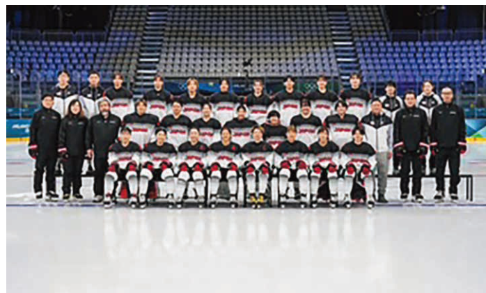
女子アイスホッケー日本代表チーム

ダイニングはイタリア料理がベースで、肉類各種、野菜、乳製品が豊富でした。ドーピングコントロールについては、18名の選手が