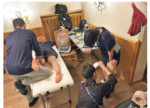
写真3 トレーナーのケア・コンディショニングの様子 選手のケアの横で、病態に合わせたテーピング法について検討が行われていた。