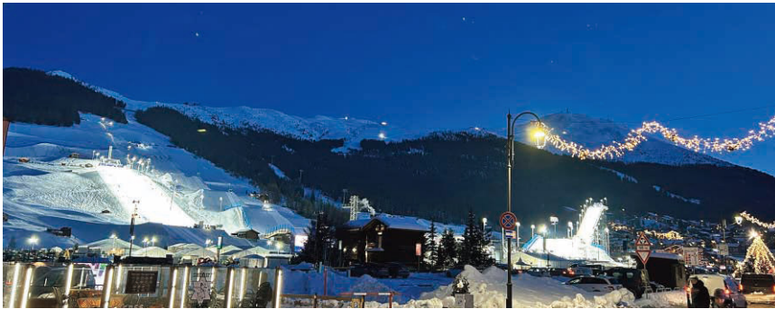
写真1 街から見た競技会場(夜) 左のライトアップされたハーフパイプの左隣にはクロスのコース、右隣にはスロープスタイルコース、右はビッグエア。

期間中は多くの印象深い選手達に出会えました。入村前にケガをしてしまった選手の驚異的な回復、初出場から8年でとうとう金メダルを獲得した選手の人間の成長、金メダルを目指し競技力だけではなく周囲から応援されるような人物になるべく努力する選手など。今大会では史上最多の24個のメダルを獲得してくれました。フィギュアスケートペア“りくりゅう”の大逆転金メダル、スピードスケート高木美帆選手の個人史上最多10個のメダル獲得、スキージャンプ団体の北京大会からのリベンジメダル獲得など。その中でリビーニョが最もメダル数も多く、大変盛り上がったオリンピックとなりました。またトレーナーのケア・コンディショニング総数は160件を超え、これも史上最多かと思えます。この場をお借りして、共に戦った仲間たちに感謝申し上げます。